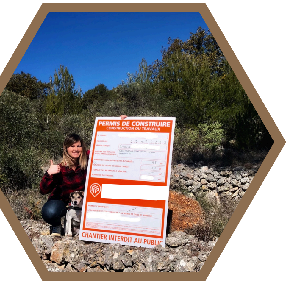
Février 2022 - Obtention permis de construire

Débuté en 2021, La Cabane de Bellevue a pour vocation première d'appuyer mes activités de conseil, d'éco-conception et d'accompagnement en proposant "comme une maison témoin" . Témoin par rapport à l' expérience chantier et aux diverses problématiques que j'ai pu rencontrer mais aussi témoin en tant qu' occupante .